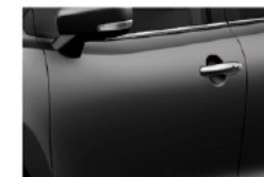
Gris Granito Metalizado (ZTN)