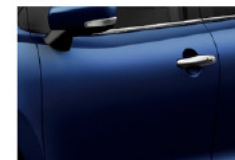
Azul Urban Perlado Metalizado (ZQT)