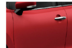
Rojo Fuego (Z4Q)