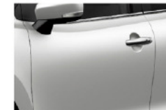
Blanco Ártico Perlado Metalizado (ZHJ)