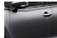
Gris Brillante Metalizado (ZNZ)