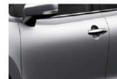
Plata Premium Metalizado (ZQS)