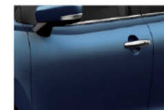
Azul Premium Perlado Metalizado (Z9Q)