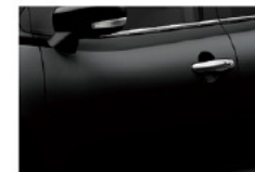
Negro Cósmico Perlado (ZAM)