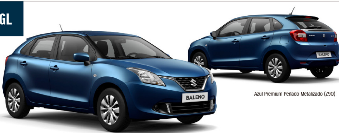
Azul Premium Perlado Metalizado (Z9Q)