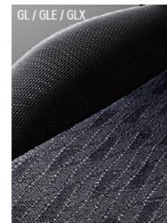
GL / GLE / GLX