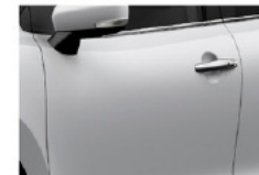
Blanco Superior (Z6U)