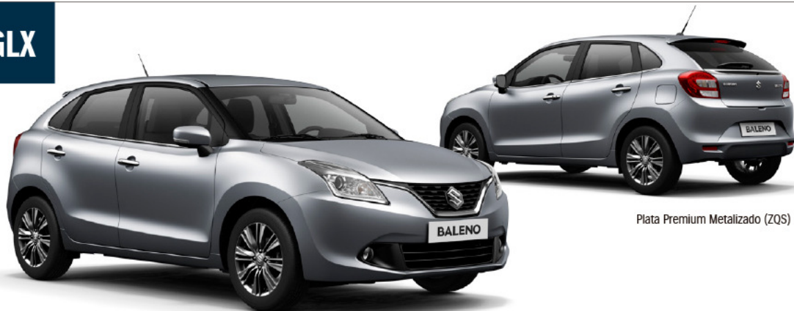
Plata Premium Metalizado (ZQS)