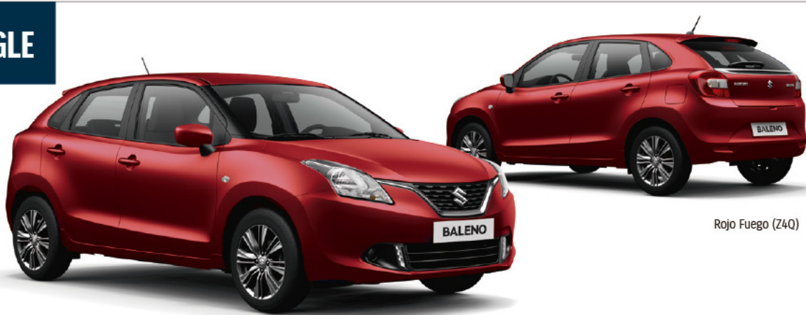
Rojo Fuego (Z4Q)